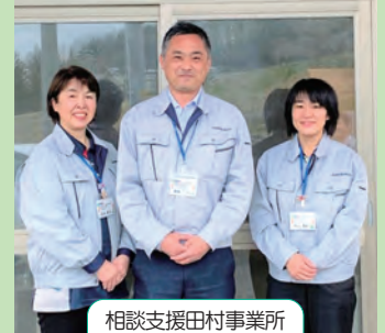
相談支援田村事業所 スタッフ

今年度より、法人内に田村市からの委託を受けた「児童発達支援センター」の開所に伴い同じ敷地内に移転しました。これにより相談窓口が一本化され、療育を利用する児童・保護者様が安心して利用・相談できる体制が整いました。