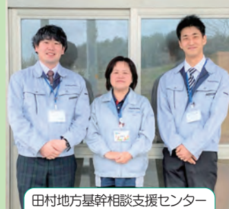
田村地方基幹相談支援センター スタッフ