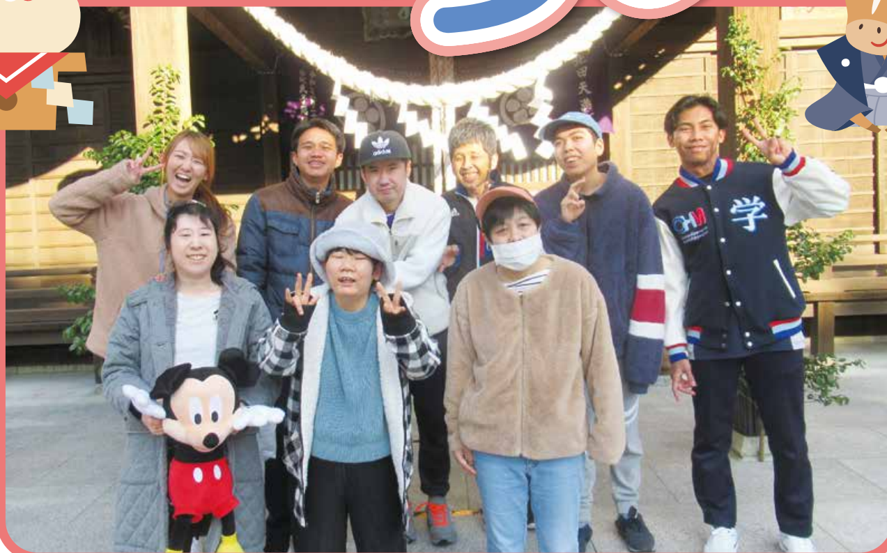
檜葉町天神岬公園内の北田天満宮へ初詣に行きました。(P4参照)